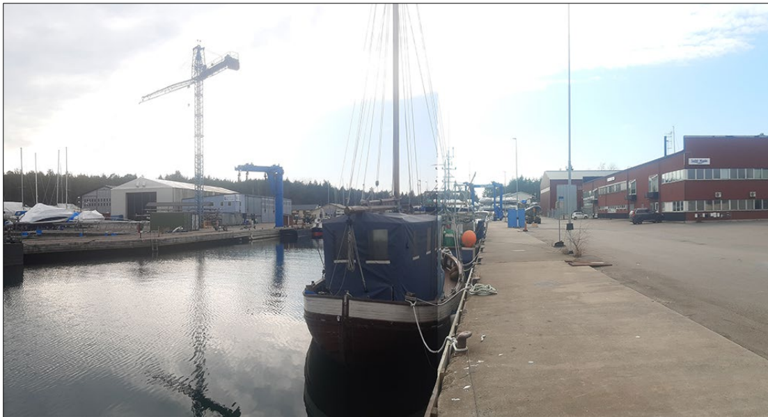
Varvsområdena i Östersviken sett ifrån öster, med ett planändringsområde på vardera sidan viken.

som tillhör Ändring av detaljplan för del av Östersviken (del av Femöre 1:3 & 1:9) Oxelösunds kommun, Södermanlands län.