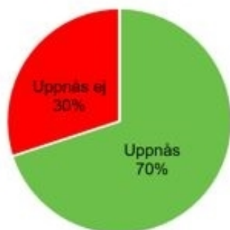
Diagram – Andel totalt uppfyllda och ej uppfyllda mål från Kommunfullmäktige och nämnder.

Andel uppfyllda mål från KF och Nämnder (77 stycken) uppgår till 70% vilket är 16 procentenheter bättre än 2021 (54%).