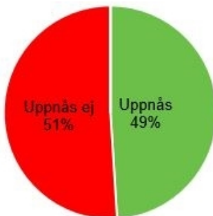
Diagram 2 - Andel uppnådda / ej uppnådda KF-mål