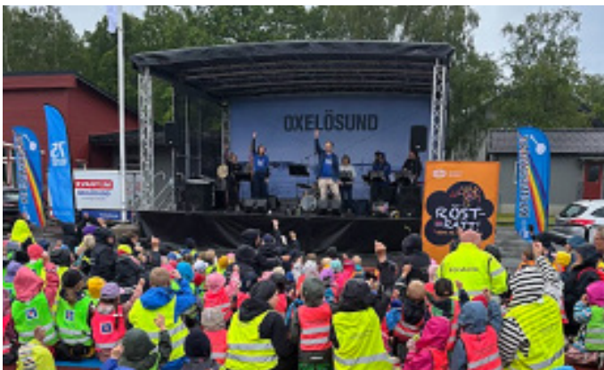
I juni samlades alla barn och pedagoger från våra kommunala förskolor på Ramdalens IP för att sjunga tillsammans med Kulturskolan och Scenkonst Sörmland i sångprojektet "Hela förskolan sjunger".

Tryggheten i kommunen bedöms som god, vilket bekräftas i både polisens och SCB:s undersökningar.