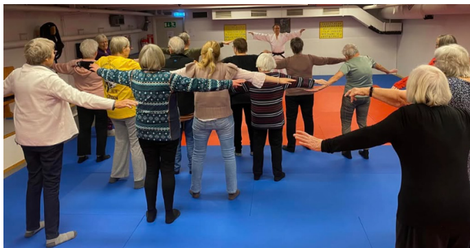
På onsdagar har Seniorträffen tillsammans med Judoklubben anordnat lättare gymna med balans- och fallövningar, för att förebygga fall för kommunens seniorer.