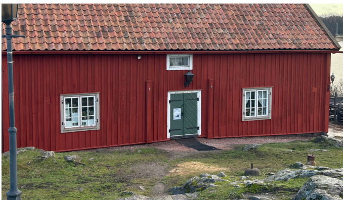
I början på året var Oxelö krog färdigrenoverat. Oxelö krog är en av kommunens äldsta byggnader. Renoveringen har med utgångspunkt i byggnadens långa historia och ålder anpassat åtgärderna för att tillvarata de kvaliteterna som ännu finns kvar och återskapa delar som gått förlorat.