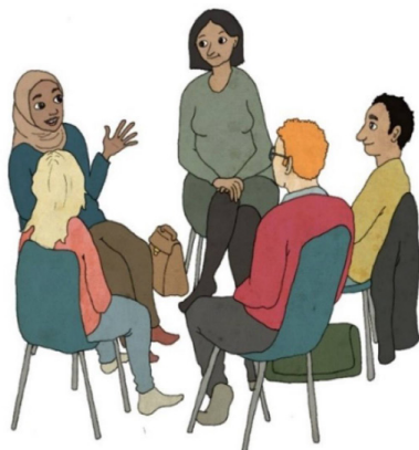
Arligen bjuds förälder till en tonåring in till att delta i en föräldragrupp. Att vara förälder till en tonåring kan vara både spännande och ibland även utmanande. ABC tonår är en kostnadsfri föräldrautbildning för den som är förälder till en ungdom mellan 13–18 år.