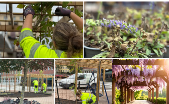
Under året har kommunen lagt en hel del pengar på blomsterarrangemang som uppskattats mycket av både invånare och besökare. På bilden läggs sista handen på pergolan vid Järntorget. Tanken är att det till sommaren 2026 ska se ut som på sista bilden. Ett härligt Blåregn som det går att sitta under och njuta av.