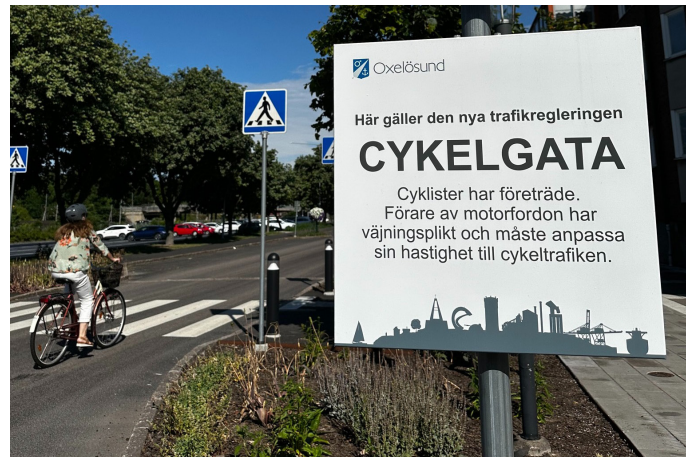
En del av torggatan blev cykelgatan. Där har cyklister företräde och förare av motorfordon har väjningsplikt och måste anpassa hastigheten till cykeltrafiken.