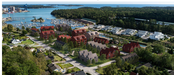
Fiskarhedenvillans förslag på bebyggelse i Badhusviken – observera att bilden är en skiss! Arkitektfirma bakom skisserna är AART och landskapsarkitekt är Kungsladan AB

I Badhusviken planeras en ny stadsdel med bostäder och allmänna ytor nära havet och naturen. Badhusviken är planerad att utvecklas till en attraktiv och levande stadsdel med bostäder, rekreationsområden och mötesplatser nära havet. Området omges idag av en blandning av äldre villor, kedjehus och punkthus. En del av villorna härstammar från tiden då området var en blomstrand badort och namnet Badhusviken har sitt ursprung därifrån.